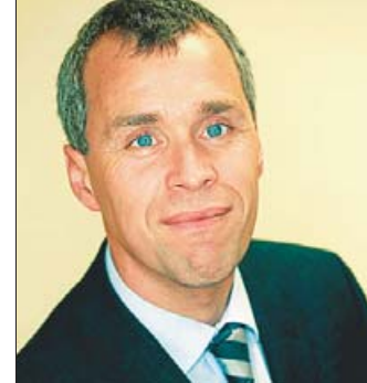
Autoren dieses Beitrags: Dr. Bernhard Becker, comes Unternehmensberatung, Oldenburg, und Vorstandsmitglied des Fördervereins Präventionsrat Oldenburg e.V., und Melanie Blinzler, Geschäftsstelle Präventionsrat Oldenburg.

Der Präventionsrat Oldenburg (PRO) ist eine dieser „Mittlerorganisationen“, bei der durch Kooperationen zwischen Bürgern, Unternehmen und Non-Profit-Organisationen gemeinsame Interessenslagen besser gebündelt werden können. Weiter heißt es bei der Bertelsmann Stiftung, dass allein die Suche nach geeigneten Partnern für neue gesellschaftliche Kooperationen eine anspruchsvolle Angelegenheit sei: „Unternehmen können sich angesichts unzähliger lokaler Vereine, Initiativen und Selbsthilfegruppen kaum einen Überblick über das unübersichtliche Feld der gemeinnützigen Organisationen verschaffen. Auch können sie nur schwerlich einschätzen, welche Organisation als Projektpartner vertrauenswürdig und geeignet ist.“ Vor gleichem Hintergrund wurde das Projekt INES (Information, Nachhaltigkeit, Evaluation und Simulation) beim PRO ins Leben gerufen. Hier wird derzeit die Möglichkeit untersucht, wie eine intermediäre Stelle dieser Fragestellung nach Koordination gerecht werden kann. Der PRO, in der Funktion als Mittlerorganisation, unterstützt neben anderen Organisationen auch eine Fülle an Projekten, die dem oben genannten Anspruch gerecht zu werden versuchen. Die Mediatorenschulung über das Projekt „Fair kann mehr – nachhaltig konfliktfähig“ hat beispielsweise zum Ziel, Schülern eine